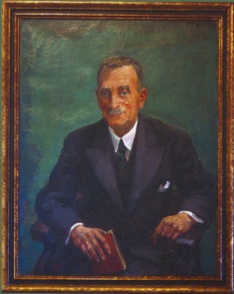
Fritz Steisslinger, Porträt Georg Kraut (1937)