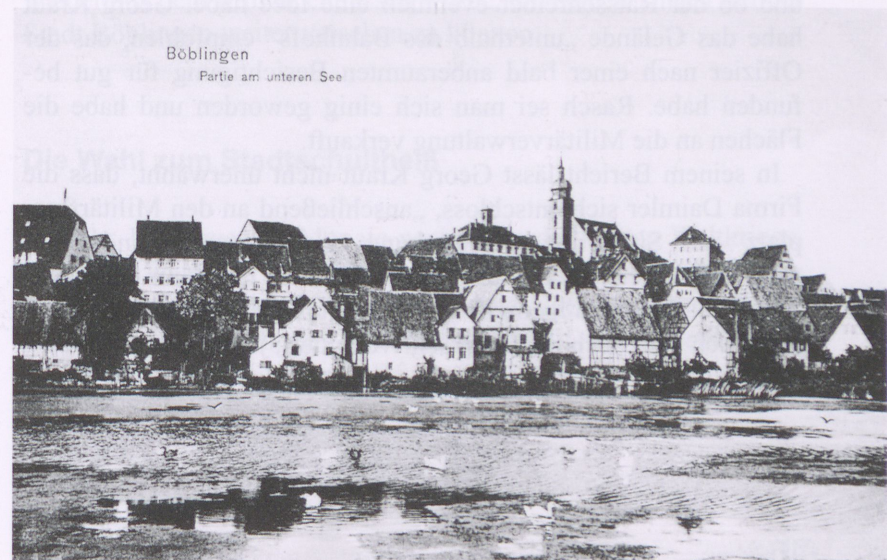
Ein Blick auf das alte Böblingen mit dem Unteren See

Die späteren, noch ruhigen Jahre der Kaiserzeit brachten für Böblingen auf der anderen Seite auch einige positive Veränderungen. Die Verlegung einer Gasleitung im Jahr 1910 war im Hinblick auf die Energieversorgung eine klare Verbesserung der Infrastruktur, ebenso der Anschluss an die Quelle in Aidlingen im Hinblick auf die Wasserversorgung. Im Jahr 1912 wurde eine Frauenarbeitsschule in Böblingen eingerichtet. Die Ansiedlung der Möbelfabrik Renz im Jahr 1914 brachte weitere Arbeitsplätze. Im selben Jahr ereignete sich jedoch, was der amerikanischen Historiker George F. Kennan die „Urkatastrophe des 20. Jahrhunderts“ nannte: Der Ausbruch des Ersten Weltkriegs.