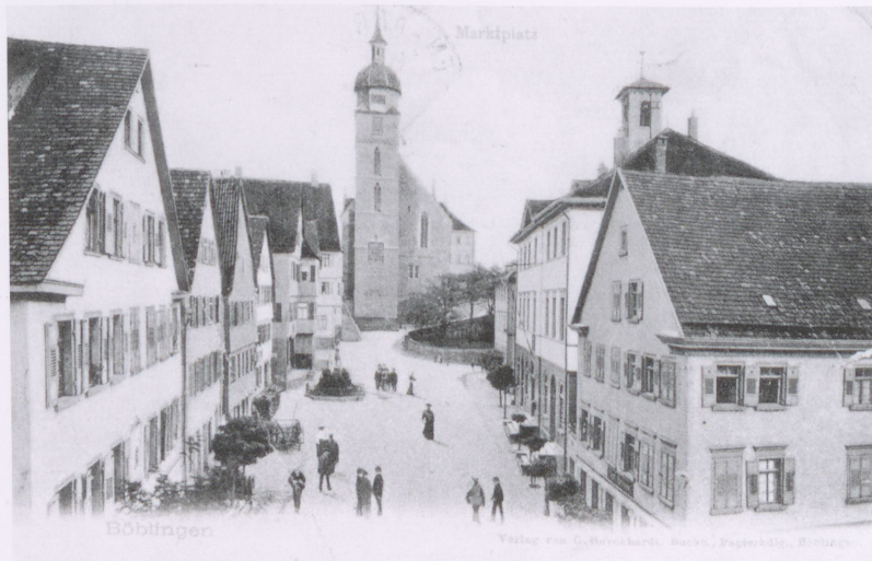
Alte Ansicht des Böblinger Marktplatzes. Das damalige, heute nicht mehr vorhandene Rathaus steht rechts in der Mitte, zu erkennen am kleinen Turmaufsatz