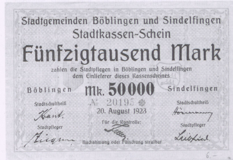
Das von den Städten Böblingen und Sindelfingen herausgegebene, originell gestaltete Notgeld

Nachdem die Hyperinflation durch die Einführung der so genannten „Rentenmark“ bezwungen war – die Nutzung von Notgeld war nun nicht mehr nötig –, schienen bessere Jahre für die deutsche Republik zu kommen. Und in der Tat konnte man in den Jahren von 1924 bis 1929 einen gewissen Aufschwung verzeichnen. Auch außenpolitisch tat sich manches, was zur Entspannung der Lage in Europa beitrug, selbst die harten Bestimmungen des Versailler Vertrages wurden, wenn nicht aufgehoben, so doch in vielen Punkten abgeschwächt, eine Entwicklung, die sich besonders gut am Beispiel des Böblinger Flugplatzes zeigen lässt.